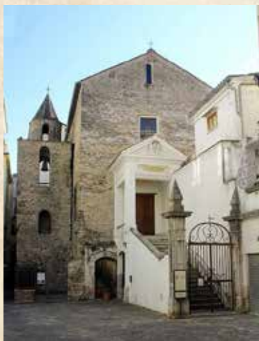
SAN PIETRO A CORTE

Gli importi sopra indicati si intendono IVA inclusa.