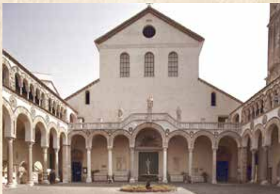
DUOMO DI SALERNO

Potranno esprimere la loro preferenza se intendono presentarli in forma di relazioni o poster. La commissione scientifica, presieduta dalla prof.ssa Dana Baran, selezionerà i lavori ed indicherà le modalità di presentazione (orale o poster). Le relazioni dovranno avere una durata massima di 15 minuti. Gli autori delle presentazioni scelte per il congresso saranno contattati entro il 20 agosto 2024.