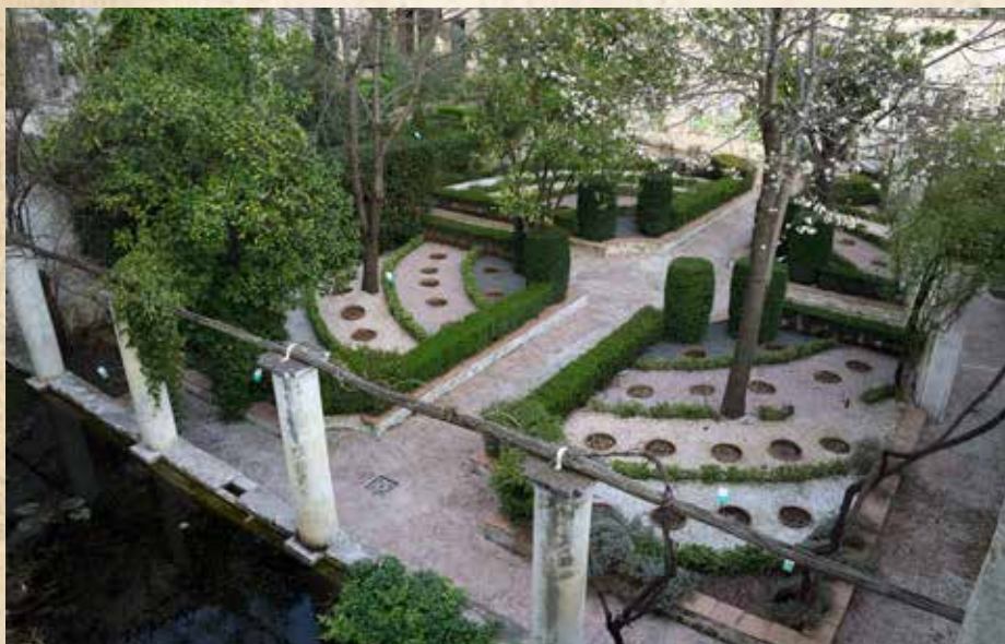
GIARDINI DELLA MINERVA