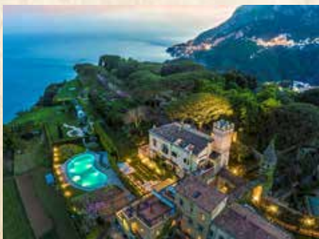
VILLA CIMBRONE - RAVELLO