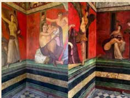
VILLA DEI MISTERI - POMPEI